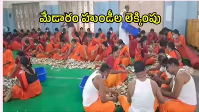
మేడారం హుండీల లెక్కింపు

వస్తున్నాయని పేర్కొన్నారు. ఇప్పటివరకు దాదాపు 18 దేశాలకు చెందిన నోట్లు వచ్చాయని వెల్లడించారు. మిగిలిన హుండీల లెక్కింపు ప్రక్రియ కూడా ముమ్మరంగా సాగుతోందని ఆలయ నిబ్బంది పేర్కొన్నారు. లెక్కింపు పూర్తి కావడానికి మరో రెండురోజుల సమయం పట్టవచ్చని నిబ్బంది అంచనా వేశారు. ఇప్పటివరకు డబ్బులు మాత్రమే లెక్కిస్తుండగా.. ఈ నోట్లు మొత్తం లెక్కించడం పూర్తి అయిన తర్వాత బంగారం, వెండి