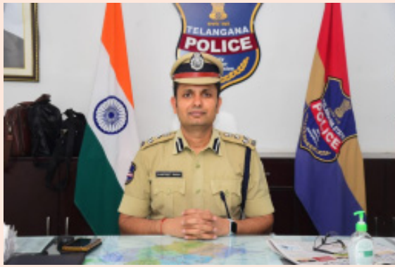
పార్టీలు నిరంతరం పెట్రోలింగ్ పోలీస్ బృందాలు పెట్రోలింగ్ నిర్వహిస్తారని పోలీస్ కమిషనర్ వెల్లడించారు.

మున్సిపల్ ఎన్నికలను ప్రశాంతంగా నిర్వహించేందుకు పకడ్బందీ ఎర్పాట్లు చేసినట్లుగా వరంగల్ పోలీస్ కమిషనర్ తెలిపారు. బుధవారం వరంగల్ పోలీస్ కమిషనరేట్ పరిధిలోని జనగామ, ఘన్పూర్, వర్మన్నపేట, వరకాల, నర్సంపేట మున్సిపల్ ఎన్నికల బందోబస్తు నిర్వహణ కోసం 1100 మైగా పోలీసులను వినియోగించడం జరుగుతుందని ఇందులో ముగ్గురు డిసిపిలతో పాటు ఐదుగురు అదనపు డిసిపిలు 4మంది, ఏసిపిలు 11మంది, ఇన్స్పెక్టర్లు 125 మంది, ఎస్.ఐలు 113 మంది, ఏ.ఎస్.ఐ/హెడ్ కానిస్టేబుళ్ళు, కానిస్టేబుళ్ళు 515, హోంగార్డ్స్ 226 మంది వీరితో పాటు డిప్యూటీ గార్డ్స్, బాంబ్ డిస్పోజిషన్ విభాగాలకు చెందిన సుమారు 168 సిబ్బంది విధులు నిర్వహిస్తున్నారు. ఎన్నిక వేళ అదనపు డిసిపి స్థాయి వర్యవేక్షణలో స్పెషల్ డ్రెస్సింగ్ ఫోర్స్ నియమించడం జరిగిందని, ఎన్నికల జరిగే ప్రతి మున్సిపల్ పరిధిలో ఒక ఏసిపి స్థాయి అధికారిని ఇంచార్జ్గా ఉంచారు. రూటు మొబైల్స్ టీంలు, షాడో పార్టీలు, ప్రతి పోలింగ్ కేంద్రంలో ఒక ఎస్.ఐ/ఎస్.ఐతో పాటు హెడ్ కానిస్టేబుళ్ళు, కానిస్టేబుళ్ళు, హోంగార్డులు విధులు నిర్వహిస్తారని, మొత్తం